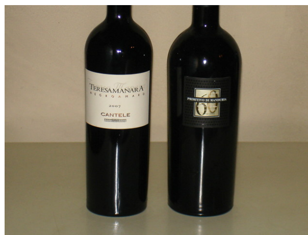
Il Negroamaro e il Primitivo della nostra degustazione comparativa

Il Primitivo è stata la prima uva di Puglia a uscire dai confini della regione e a conferire notorietà ai vini di quest'area. Per anni si è discusso sull'origine di questa celebre uva rossa. Le tante ricerche effettuate hanno consentito una migliore conoscenza dell'uva Primitivo fino a scoprire altre varietà con caratteristiche genetiche uguali alla celebre rossa di Puglia, a partire dallo Zinfandel, nome con il quale si conosce negli Stati Uniti d'America il Primitivo. Questi studi hanno inoltre rivelato che anche la varietà rossa Crljenak Kaštelanski coltivata in Croazia è geneticamente analoga al Primitivo. Questa sco-