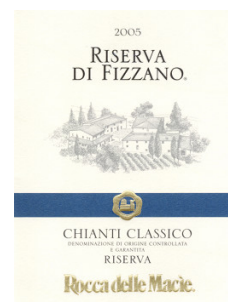
Chianti Classico Riserva di Fizzano 2005 Rocca delle Macie (Toscana, Italia)

Abbinamento: Paste ripiene, Carne arrosto, Stufati di carne con funghi