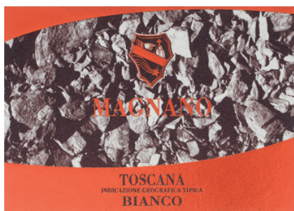
Magnano 2009 Buccia Nera (Toscana, Italia)

Abbinamento: Selvaggina, Carne arrosto, Stufati e brasati di carne, Formaggi stagionati