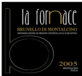
Brunello di Montalcino 2005 La Fornace (Toscana, Italia)

Abbinamento: Carne arrosto, Carne alla griglia, Brasati e stufati di carne, Formaggi stagionati