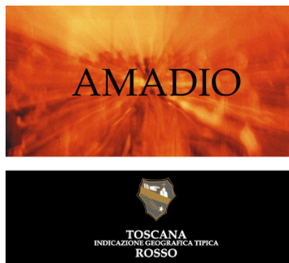
Amadio 2007 Buccia Nera (Toscana, Italia)

Abbinamento: Pasta e risotto con pesce e verdure, Zuppe di verdure, Pesce saltato