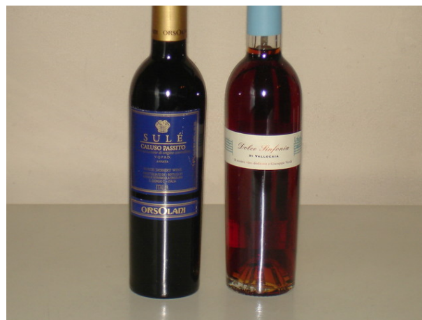
L'Erbaluce di Caluso Passito e il Vin Santo della nostra degustazione comparativa

L'origine della varietà Erbaluce è incerta, tuttavia si ritiene che questa varietà a bacca bianca sia originaria del canavese, il territorio che si estende a nord di Torino fino alla Valle d'Aosta. La diffusione dell'Erbaluce è praticamente limitata in questo territorio e, in particolare, a Caluso, luogo che ha legato il proprio nome all'uva Erbaluce e che, nell'Ottobre 2010, ha ottenuto il riconoscimento della Denominazione d'Origine Controllata e Garantita DOCG. Uva molto versatile, grazie alla spiccata acidità unitamente alla dolcezza dei suoi acini, con