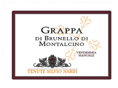
Grappa di Brunello di Montalcino Tenute Silvio Nardi (Toscana, Italia) (Distillatore: Distillerie Colessi)

I punteggi delle acqueviti sono espressi secondo il metodo di valutazione di DiWineTaste. Fare riferimento alla legenda dei punteggi nella rubrica "I Vini del Mese".