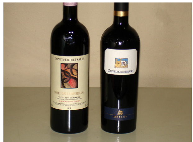
Il Nebbiolo e il Merlot della nostra degustazione comparativa

Molti sono infatti disorientati da queste due qualità, poiché rendono innegabilmente più complessi e meno immediati i vini prodotti con Nebbiolo. Le sue caratteristiche "ruvide", impongono - per così dire - un'opportuna maturazione in botte, così da arrotondare le sue asperità e rendere i vini più equilibrati. Nelle aree dove in Nebbiolo è tradizionalmente presente, la scelta più frequente è in favore della botte grande, anche se in tempi relativamente recenti, anche la barrique è stata ampiamente utilizzata. Questo tipo di scelta, va da sé, influisce notevolmente sul risultato finale, non solo sul tipo di aromi terziari che il vino può sviluppare, ma anche sui tempi di maturazione. Non da ultimo, è una questione di "gusti" e di espressione del vino. Se nella barrique il carattere legnoso è maggiormente presente, la maturazione in botte grande, pur caricando il vino di qualità terziarie, lascia maggiore spazio all'eleganza e alle qualità fruttate del Nebbiolo.